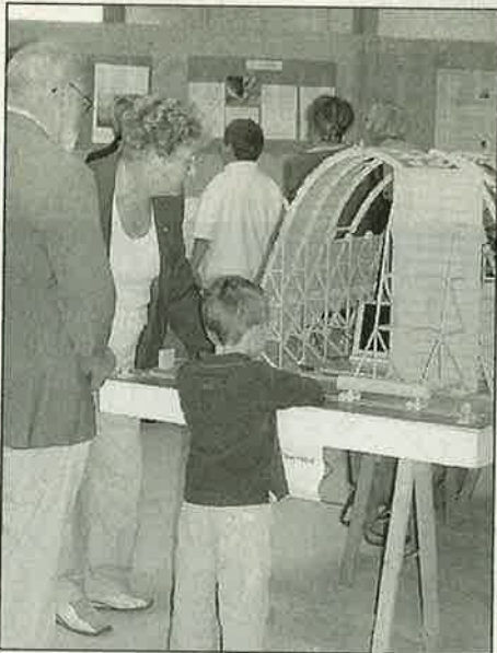
Petits et grands s'intéressent aux maquettes.

Au cours de l'après-midi, une exposition commentée de documents, maquettes, photographies sur l'histoire du hangar à dirigeables, sa construction et de nombreux projets sont en cours pour qu'il retrouve un véritable centre d'intérêt pour la région. Une vidéo était également présentée dans la salle d'animations sur le site du hangar.