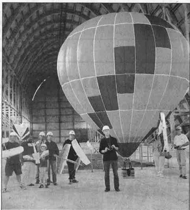
Démonstrations de dirigeables télécommandés et d'avions modèles réduits dans le hangar.