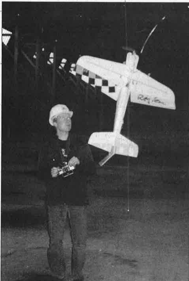
Présence des Choucas de Saint-Floxel aux portes ouvertes des 15 et 16 septembre au hangar.

état relativement bien conservé va peut-être connaître un nouvel essor. L'association propriétaire ayant consenti à le vendre. Le sujet sera inscrit à l'ordre du jour de la prochaine réunion de la Communauté de Communes qui aura lieu le 18 septembre à 20 h 30 au lieu habituel de ses séances et où les délégués auront à se prononcer pour ou contre l'achat du hangar et des ses sept hectares de terrain qui l'entourent.